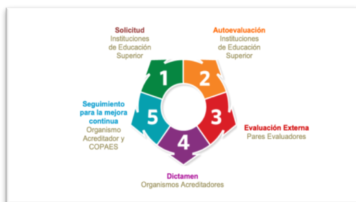
Figura 1. Etapas generales del proceso de acreditación.

El Consejo Nacional de Acreditación en Informática y Computación A.C. (CONAIC) en el Marco de Referencia para la Acreditación de Programas Académicos de Informática y Computación, EDUCACIÓN SUPERIOR, Énfasis Internacional y Resultados [2], Versión 3.0. Capítulo III - Proceso de evaluación con fines de Acreditación menciona las siguientes etapas: